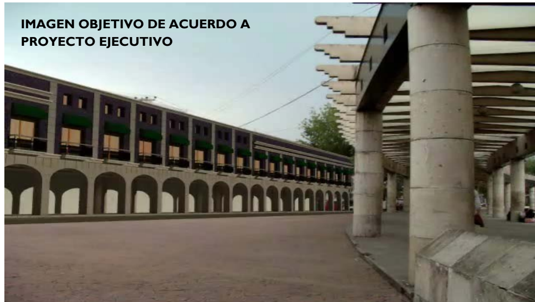
IMAGEN OBJETIVO DE ACUERDO A PROYECTO EJECUTIVO

Construcción De Un Portal En Dos Niveles, Que Incluye Tratamiento De Piso, Mobiliario Urbano, Vegetación Y Tratamiento De Fachadas Sobre La Calle 5 De Febrero.