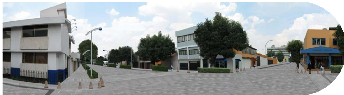
IMAGEN OBJETIVO DE ACUERDO A PROYECTO EJECUTIVO