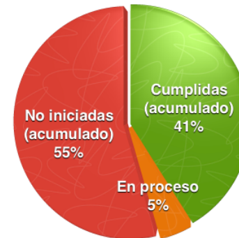
Cumplimiento del pilar (acumulado)