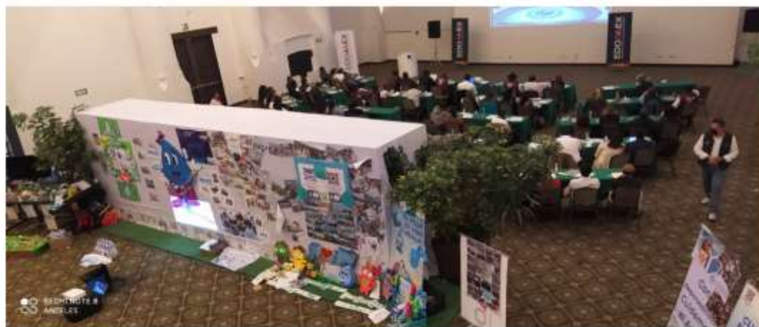
Figura 2. Vista general de sede y asistentes en la Jornada de Capacitación.

DIFUNDIR ACCIONES ORIENTADAS A LA EVALUACIÓN DE LA CALIDAD DE LA PRESTACIÓN DE LOS SERVICIOS DE AGUA EN EL ESTADO