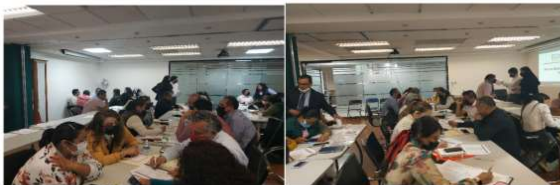
Figura 3. Vista general de los asistentes a la tercera actividad reportada.